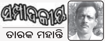
ସମାବଦାନ ତାରକ ମହାନ୍ତି