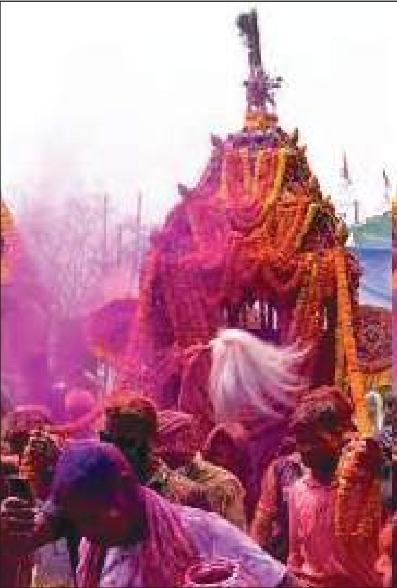
ଅତିରିକ୍ତା ହିଁ ନଥାଏ। କାରଣ, ଏହା ଉତ୍ତୁଷ୍ଟ ମାସ ଏବଂ ଉତ୍ତୁଷ୍ଟର ଉତ୍ତୁଷ୍ଟ ବା କ'ଣ ହୋଇପାରେ। ଭଗବାନ ଶ୍ରୀକୃଷ୍ଣ ଗୀତାରେ ନିଜ ସ୍ୱରୂପ ବର୍ଣ୍ଣନାରେ କହିଛନ୍ତି ଯେ ସେ ଉତ୍ତୁନା କୁସୁମାକର ଅର୍ଥାତ୍ ଉତ୍ତୁମାନଙ୍କ ମଧ୍ୟରେ ବସନ୍ତ। ଯିଏ ଉତ୍ତୁମାନ ସ୍ୱରୂପ, ତା'ଠାରୁ ଆଉ ସୌନ୍ଦର୍ଯ୍ୟ

କେଉଁଠି ବା ରହିଛି। ଏହି ଋତୁଟି ପାଇଁ ପୁରା ବର୍ଷ ପ୍ରସ୍ତୁତି ଚାଲିଥାଏ ପ୍ରକୃତି। ଯେମିତି ଯୌବନକୁ ଆଣିବା ଲାଗି ଶୋହଳ ବର୍ଷ ପର୍ଯ୍ୟନ୍ତ ମାନବୀୟ ଶରୀର ସାଧନା କରୁଥାଏ, ମା' ନଅ ମାସ କାଳ ବିଭିନ୍ନ ଗର୍ଭ ପର୍ଯ୍ୟାୟ ଅତିକ୍ରମ କରିବା ପରେ ନବାଗତଟିଏ ଭୃତ୍ତିକୃତ କରେ ଏବଂ ଉତ୍ତୁଷ୍ଟ ଭାବିବିଏ। ବସନ୍ତ ପ୍ରକୃତିର ଯୌବନ ଏବଂ ଋତୁନାତ୍ମକତା ଚରମ ପର୍ଯ୍ୟାୟ। ଶୋକକଳାରେ ସକେଇ ହୁଏ ପ୍ରକୃତି। ମଣିଷ ସମେତ ପୁରା ପ୍ରାଣୀଜଗତ ପାଇଁ ଅନୁକୂଳ ଏହି ଋତୁ। ରଙ୍ଗର ଋତୁ ବସନ୍ତ। ଆଶା ଏବଂ ସିଦ୍ଧିର ସୁନ୍ଦର ସଂଯୋଗ, କଳ୍ପନା ଓ ବାସ୍ତବିକତାର ସୁରୁତ ସମନ୍ୱୟ। ନିରାଶା ଉପରେ ଆଶା ଏବଂ ଅମଙ୍ଗଳ ଉପରେ ମଙ୍ଗଳର ବିଜୟ। ରଙ୍ଗ ସତ୍ୟ, ରଙ୍ଗ ହିଁ ଆନନ୍ଦ, ରଙ୍ଗ ସୌନ୍ଦର୍ଯ୍ୟ। ରଙ୍ଗ ପ୍ରତି ବିପୁଷ୍ପତା ଅନ୍ଧକାର ନିଶ୍ଚୟ। ଦେବଦେବ ମହାଦେବ ନିଜ ଶରୀରକୁ ଶୁଣାନ ଧୂଳିରେ ରଙ୍ଗାକ୍ତକରିଛନ୍ତି। ପରିତ୍ୟକ୍ତ ରଙ୍ଗ ତ୍ରିପୁଣ୍ଡରେ ପରିଣତ ହୋଇଛି। ଭଗବାନ ବିଷ୍ଣୁ ପ୍ରକାଶ ଅନନ୍ତ କାମନା ସଂରକ୍ଷଣର ଭାବନାକୁ ଧରି ଅନନ୍ତର ନାଳରଙ୍ଗ ନିଜ ରୂପ ଅନୁକୂଳ କରିଛନ୍ତି। ରଙ୍ଗ ନାମ ହୋଇଛି ପୁଣି ପରିଚୟ ବି ପାଳିଯାଇଛି। ସଂସାରରେ ଅନେକ ରାସାରେ ଏପରି ଶବ୍ଦ ରହିଛି ଯାହା ରଙ୍ଗ ଆଧାରିତ। ରଙ୍ଗର ମିଳନ ହିଁ ରଙ୍ଗୋତ୍ସବ ହୋଇଛି। ଇଚ୍ଛା - ଅନିଚ୍ଛାରେ ହେଉ କି ଜାଣତ - ଅଜାଣତରେ ପ୍ରତ୍ୟେକେ ରଙ୍ଗରେ ଭିଜିଯାନ୍ତି। ଶରୀର ଏମିତି ରଙ୍ଗୀନ ହୋଇଯାଏ ଯେ, ବୟସ, ବର୍ଣ୍ଣ, ଜାତି, ଧର୍ମ ସବୁ ପରିଚୟ ଉଦ୍ଧୃତ ଯାଏ। କେବଳ ରଙ୍ଗର ରାଜୁତି ଚାଲେ। ବିଷାଦ ଜଳି ଉତ୍ତୁଷ୍ଟ ହୋଇଯାଏ। ବସନ୍ତ ପ୍ରେମର ରାସ ଆଣେ। କେବଳ ଏକଇ ରଙ୍ଗ ଦୃଷ୍ଟିକୁ ଆସେ ସାଧ୍ୟଭଲ୍ଲସର, ଦର୍ପଣ-ତର୍ପଣରେ।