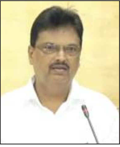
୫୧ ହଜାର ୬୫୫ ୮୩ କୋଟି ଟଙ୍କା ଅଟକଳ ହୋଇଛି । ଯାହାକି ସାମଗ୍ରିକ ରାଜ୍ୟ ଘରୋଇ