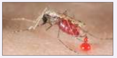
ଓଡ଼ିଶାରେ ମ୍ୟାଲେରିଆ ସଂଖ୍ୟା କ୍ରମାଗତ ଭାବେ ହ୍ରାସ ପାଇବାରେ ଲାଗିଛି ତଥାପି ଚଳିତ ବର୍ଷ ଏହା ଅଧିକ ରହିଛି । ସେହିପରି ରାଜ୍ୟରେ ଡେଙ୍ଗୁ ସ୍ଥିତି ଗମ୍ଭୀର ରହିଛି । ଗତବର୍ଷ ଏହି ସମୟରେ ଯେଉଁ ଜିଲ୍ଲାଗୁଡ଼ିକରେ ଡେଙ୍ଗୁ ରୋଗୀଙ୍କ ସଂଖ୍ୟା ୫୦ ଓପି ନ ଥିଲା ଚଳିତବର୍ଷ ସେସବୁ ଜିଲ୍ଲାରେ

ଭୁବନେଶ୍ୱର: ରାଜ୍ୟରେ ମଶାଙ୍କ ଉତ୍ପତ୍ତ ଏବେ ବଢିଛି ଯେ, ସହରରୁ ଗାଁ ସବୁଠି ମଶାଙ୍କୁ ଦେଖିଲେ ଭୟ ଲାଗୁଛି । ଗ୍ରାମାଞ୍ଚଳରେ ମ୍ୟାଲେରିଆ ବ୍ୟାପୁଥିଲା ବେଳେ ସହରରେ ଅଣାୟତ ହେଉଛି ଡେଙ୍ଗୁ । ସରକାର ଡେଙ୍ଗୁ ଉପରେ ଅଧିକ ଯୋଜନା କରୁଥିବା ବେଳେ ମ୍ୟାଲେରିଆ ଅଧିକ କରିବା ଆରମ୍ଭ କରିଦେଇଛି । ରାଜ୍ୟରେ ଡେଙ୍ଗୁ ରୋଗୀଙ୍କ ସଂଖ୍ୟା ୪ ହଜାର ପାଖାପାଖି ରହିଥିଲା ବେଳେ ମ୍ୟାଲେରିଆ ଆକ୍ରାନ୍ତଙ୍କ ସଂଖ୍ୟା ୧୦ ହଜାର ଅତିକ୍ରମ କଲାଣି । ଯଦିଓ ୨୦୧୬ ମସିହାରୁ