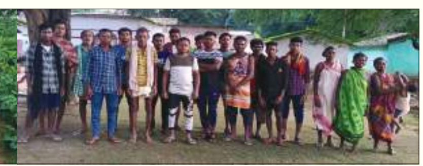
ଏହା ସହ ବିଦ୍ୟାଳୟକୁ ଯାଉଥିବା ଛୋଟ ଛୋଟ ପିଲା ମାନେ ଅଧିକ କଷ୍ଟ ଭୋଗିଥାନ୍ତି । ଗ୍ରାମ

୨୫୦ରୁ ଊର୍ଦ୍ଧ୍ୱ । ମାଟି ରାସ୍ତା ଯୋଗୁଁ ଲୋକମାନେ ବର୍ଷା ଦିନେ ଯାତାୟତରେ ଅସୁବିଧା ସମ୍ମୁଖୀନ ହୋଇଥାନ୍ତି । ଗ୍ରାମବାସୀ ବର୍ଷାଦିନେ ବୁକ୍ସ ଓ ପଞ୍ଚାୟତ କାର୍ଯ୍ୟାଳୟକୁ ବହୁ କଷ୍ଟରେ ଆସିଥାନ୍ତି ।