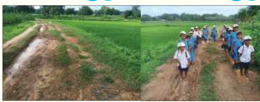
ଦୂରରେ ରହିଛି ଏହି ଗ୍ରାମ । ୫୦ରୁ ଊର୍ଦ୍ଧ୍ୱ ପରିବାର ବସବାସ କରୁଥିବା ବେଳେ ଲୋକ ସଂଖ୍ୟା

ନବରଙ୍ଗପୁର: ନବରଙ୍ଗପୁର ଜିଲ୍ଲା ତାକୁଗାଁ ବ୍ଲକ୍ ଅଧୀନ ଅଞ୍ଚଳ ପଞ୍ଚାୟତ ଅଧୀନରେ ଥିବା ଗମ୍ଭୀରିଗୁଡ଼ା ଗ୍ରାମ ସବୁ କ୍ଷେତ୍ରରେ ଅବହେଳିତ ହୋଇରହିଛି । ଗ୍ରାମବାସୀ ସ୍ୱାସ୍ଥ୍ୟ, ଶିକ୍ଷା ଓ ଗମନାଗମନ ଭଳି ମୌଳିକ ସୁବିଧାରୁ ବଞ୍ଚିତ ହୋଇ ରହିଛନ୍ତି । ଅଞ୍ଚଳ ପଞ୍ଚାୟତର ଭୂମିମାଲ ଗ୍ରାମର ଏକ ପଡ଼ା ଗ୍ରାମ ହେଉଛି ଗମ୍ଭୀରିଗୁଡ଼ା । ପଞ୍ଚାୟତର ୬ ନଂ ଖୁର୍ଡ ଭାବେ ପରିଚିତ ଏହି ଗ୍ରାମ । ପଞ୍ଚାୟତ ସଦର ମହକୁମା ଠାରୁ ୬ କି.ମି ଏବଂ ବ୍ଲକ୍ ସଦର ମହକୁମାଠାରୁ ୧୭ କି.ମି