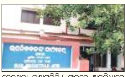
ହେଉଥିବା ଜଣାପଡିଛି । ଫଳରେ ଅସୁବିଧାରେ ପଡି କେହି ଅସଲ ଜମି ମାଲିକ ତୁରନ୍ତ ଜମି ବିକ୍ରି କରିବାକୁ ଚାହୁଁଥିଲେ ମଧ୍ୟ ତାଙ୍କୁ ମାସ ମାସ ଧରି ଅପେକ୍ଷା କରିବାକୁ ପଡୁଛି । ସାରା ରାଜ୍ୟର

ଲୋକ ସକାଳୁ ପୁରୁ ବୁକିଂ କରିବାକୁ ଚେଷ୍ଟା କରୁଥିଲେ ବି ଏହା ସମ୍ଭବ ହୋଇପାରୁନାହିଁ । ଦଳାଳମାନେ ରାତି ଅଧରେ ପୁରୁ ବୁକିଂ କରି ନେଇଥିବାରୁ ସାଧାରଣ ଲୋକ ନିରାଶ ହେଉଛନ୍ତି । ଖବର ଅନୁସାରେ ଗୋଟିଏ ଗୋଟିଏ ମୋବାଇଲ ନମ୍ବରରୁ ଏକାଧିକ ନମ୍ବର ପୁରୁ ବୁକିଂ କରିବା ଓ ସେଥିପାଇଁ କୌଣସି ଦେୟ ଜମା କରିବାକୁ ପଡୁନଥିବାରୁ ଦଳାଳମାନେ ମନଇଚ୍ଛା ପୁରୁ ବୁକିଂ କରି ରଖୁଛନ୍ତି । ଗୋଟିଏ ଗୋଟିଏ ମୋବାଇଲ ନମ୍ବରରୁ ୨୦ରୁ ଊର୍ଦ୍ଧ୍ୱ ପୁରୁ ବୁକିଂ